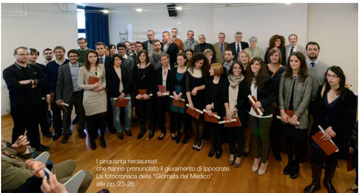
I cinquanta neolaureati che hanno pronunciato il giuramento di Ippocrate. La fotocronaca della "Giornata del Medico" alle pp. 23-26

(giornale "Trentino" del 8 dicembre 2013)