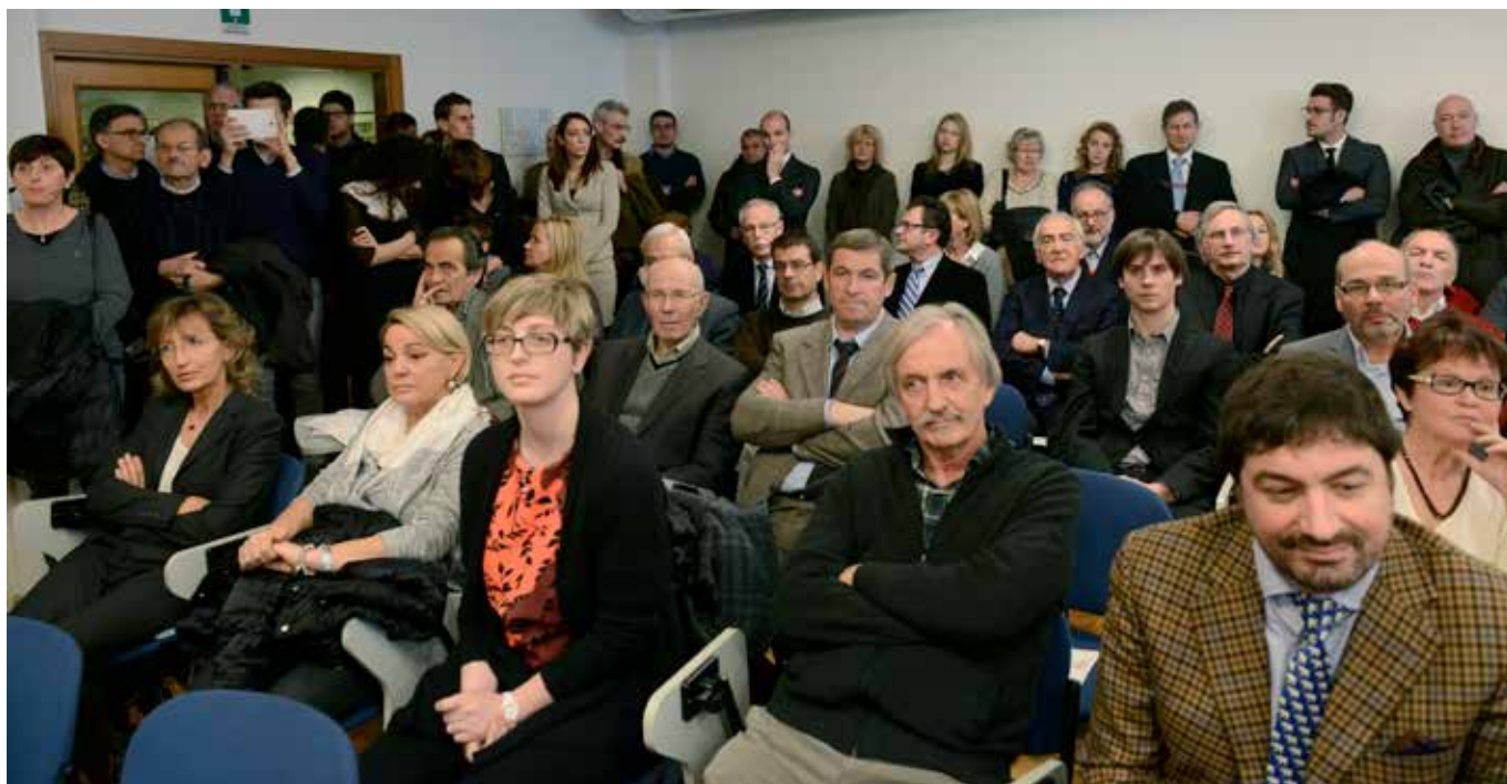
Sala gremita, sabato 7 dicembre 2013 per la "Giornata del medico" presso la sede dell'Ordine

mo necessaria una seria riflessione e confronto con gli operatori, dai quali possano emergere le nostre proposte operative. È chiaro che il mio pensiero va alla Convention di Riva del Garda.