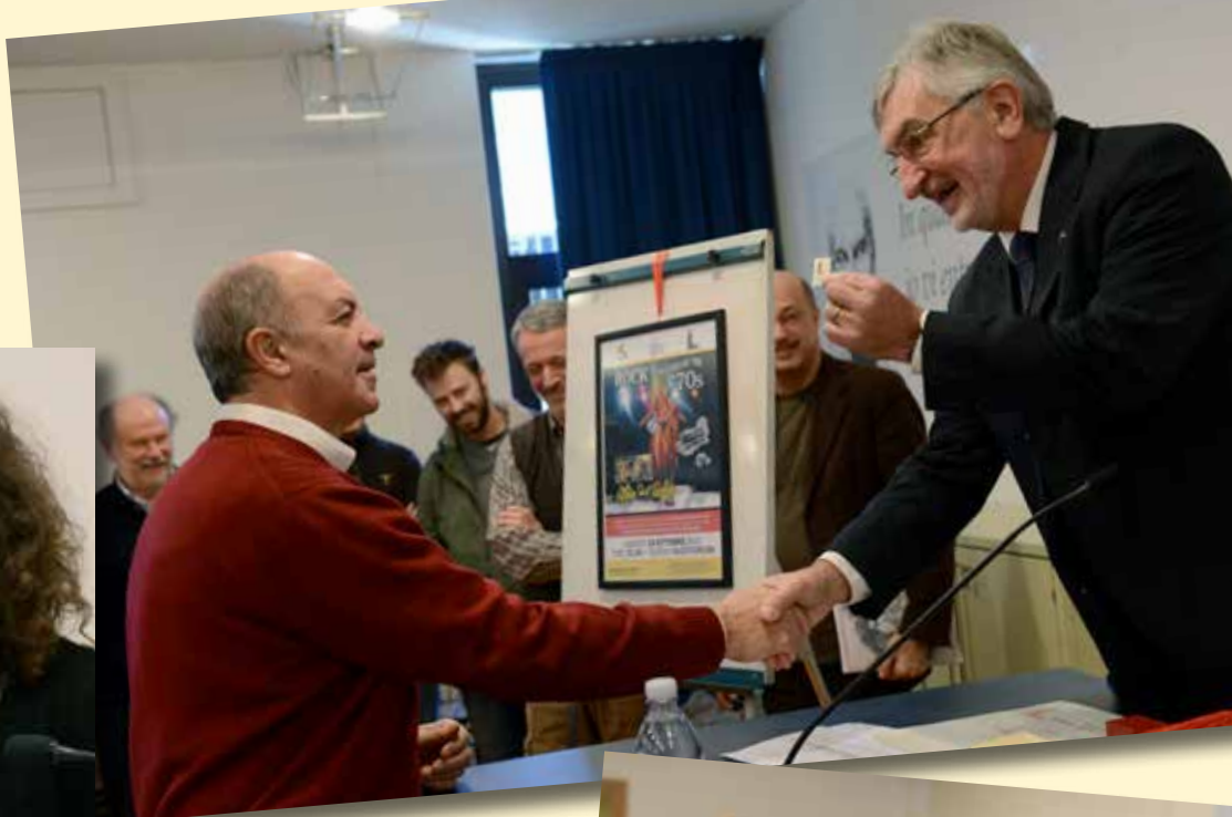
I medici-musicisti del gruppo "Oldies but goldies"