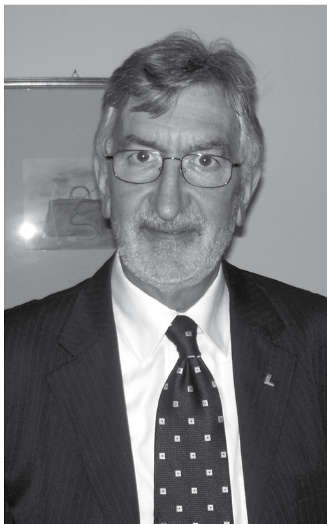
Il presidente insiste.